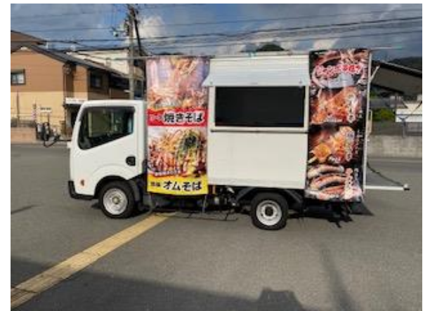
営業風景 (前出しなし)