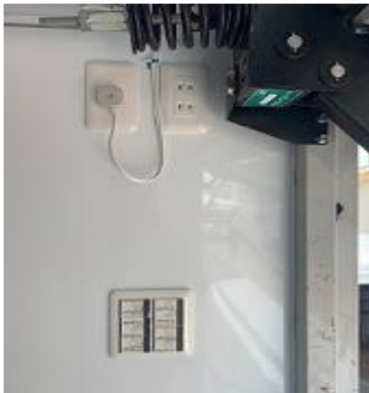
照明スイッチ (運転席側後方)