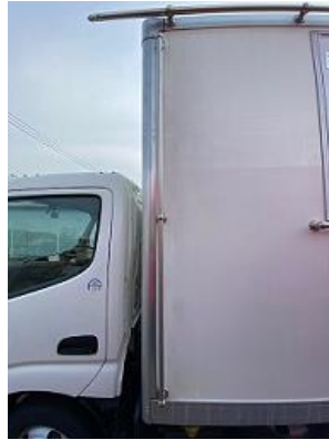
看板取り付け可能 フレーム