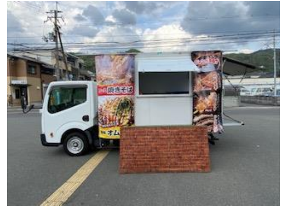
営業風景 (前出しあり)