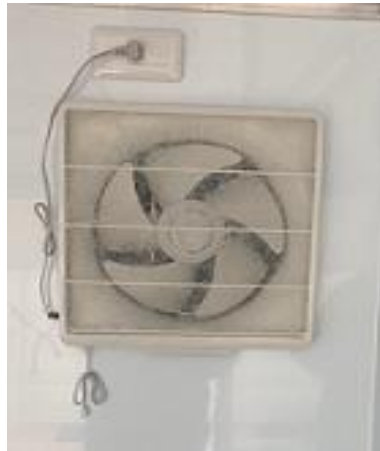
換気扇 (運転席後方)