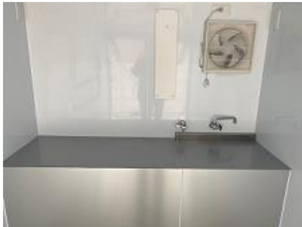
作業台、2槽シンク (蓋つき) (200Lタンク)