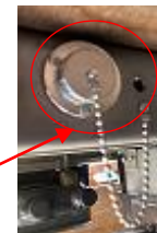
外部電源差し込み口