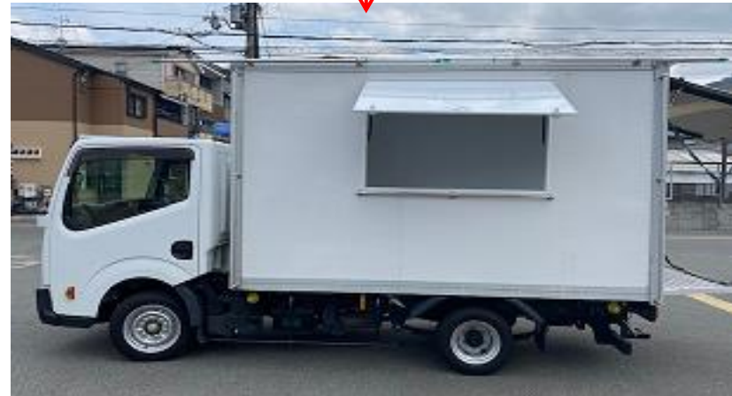
販売面 (販売口間口)