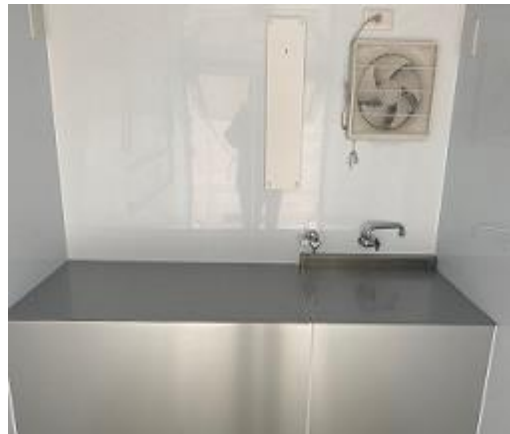
作業台 (2槽シンク蓋つき)